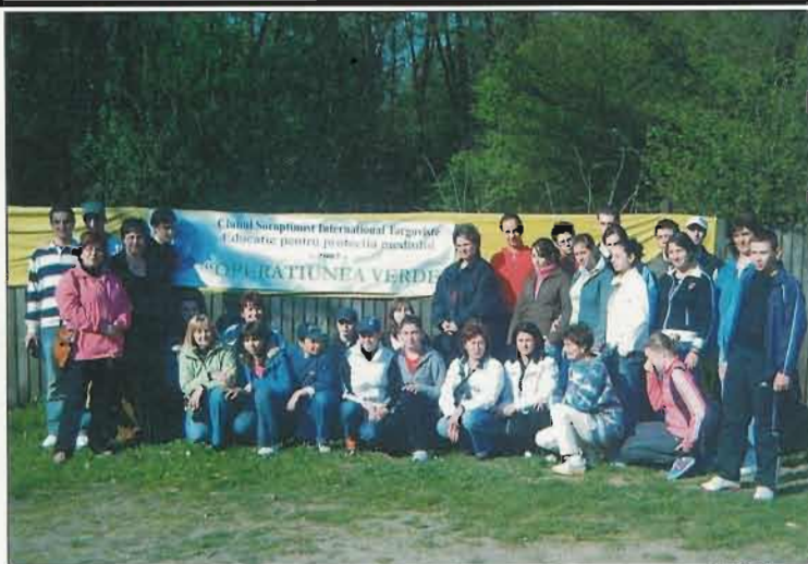
Colegiul Economic Ion Ghica din Târgoviște