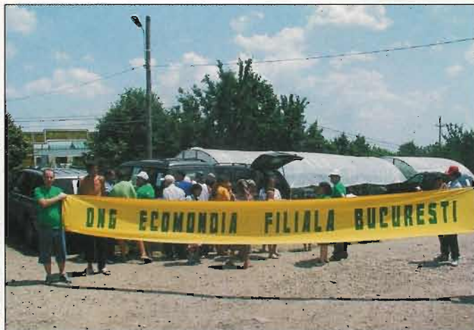
În taberele de sinistrați de la Spanțov și Mânăstirea