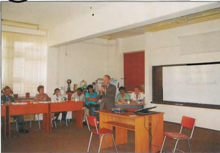
Liceul Tehnic pentru Protecția Mediului din Pitești