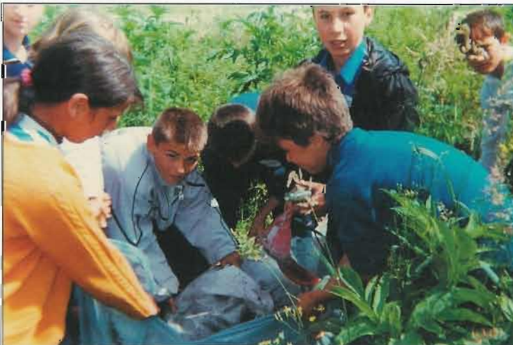
Vă plac școlarii noștri ?