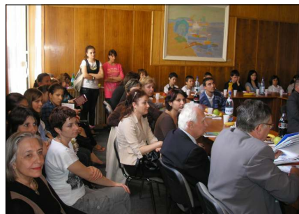
În sala de consiliu, la prezentarea cărților