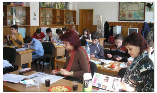
Plenara cercului de ecologie