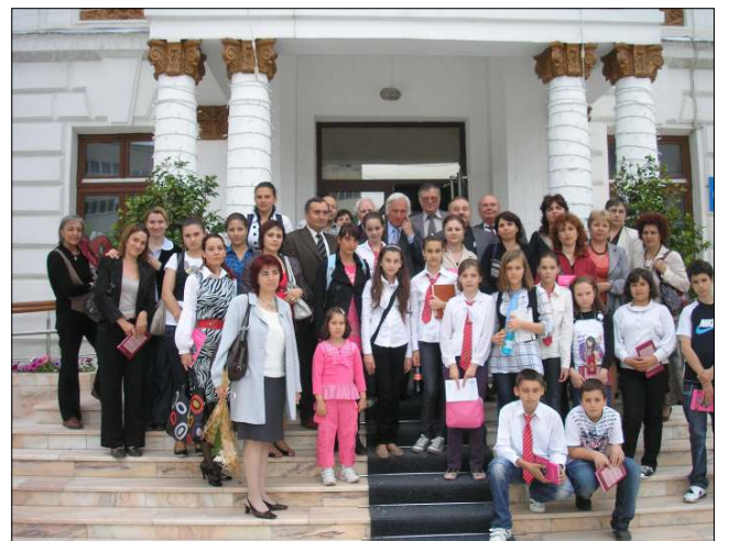
O parte dintre participanții, în fața Primăriei Municipiului Cluj-Raia

Pe 29 mai, o excursie pe traseul Cluj-Raia - București cu vizite la sediul Ecomondia, la Muzeul Satului, la Muzeul de Geologie și la cinematograful Cotroceni unde elevii au vizionat filmul Alice în țara minunilor (în 3D!). O recompensă pentru cei mai merituoși membri ai cercului de ecologie!