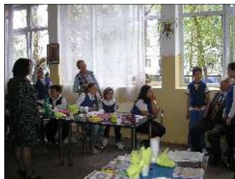
Colocviu pe teme ecologice

la Ambasada Belgiei: Ecomondia- universitari din Pennsylvania și Flandra.