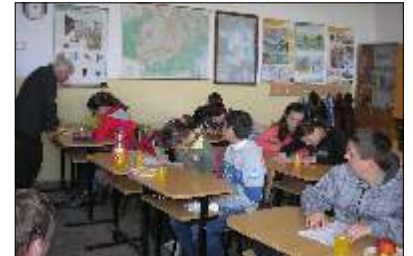
Inaugurarea cercului de ecologie

Transmiterea de cunoștințe, de sentimente, de sfaturi: mentori - profesor - elevi. Membrii cercului au făcut o excursie la Cămin (7 mai 2010).