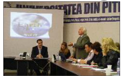
Propuneri pentru o administrare ecologică