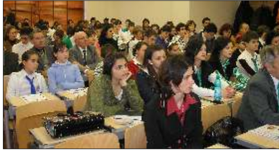
Prezentarea cerșilor Ecomondia

* Elevii cercului de ecologie Ecomondia au colaborat la igienizarea Parcului Trivale.