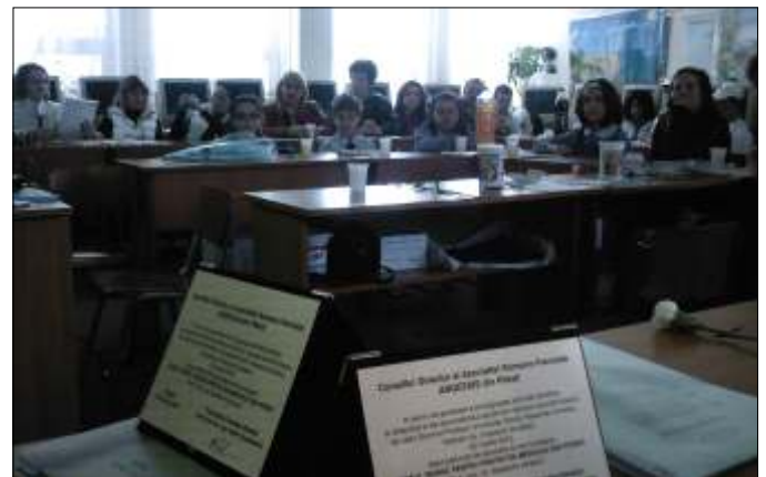
Consiliul elevilor - prezent!