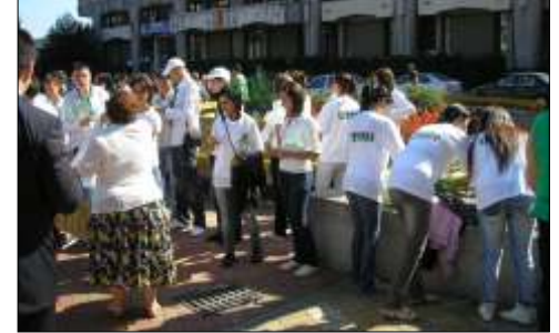
Pregătind un marș de Ziua Mediului