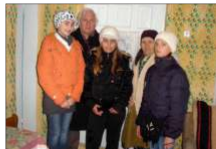
Ajutor social în satul Plumbuita

Școala din comuna Târnăveni, cu copiii adunați din satele componente, are un Cerc structurat pe elevii clasei a VII-a, activi în a propaga - prin vorbe și fapte - educația pentru mediu, coeziunea socială și activitatea cotidiană pentru o localitate curată .