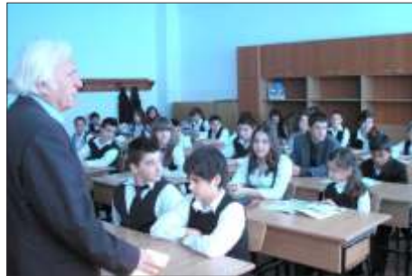
Vorbind despre ecologie

O primă luare de contact cu o școală modernă și primitivă. N-au lipsit profesorii de științele naturii și nici directorul școlii, absolvent de biologie.