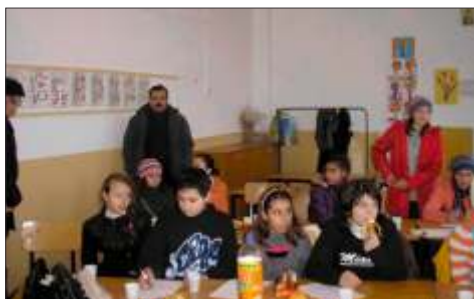
Vizita d-lui viceprimar la Cerc