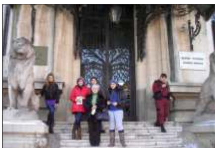
Pe treptele Muzeului George Enescu