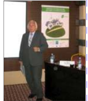
La conferin a din 5 mai