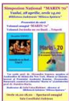
Afi ul simpozionului