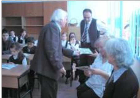
Împreună, oaspetele și profesorii