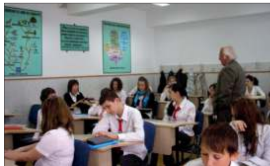
La coala general "Mihai Eminescu" - o pepinier de olimpici