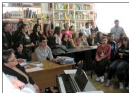
Liceul Pedagogic "Alexandru Vlahu ". Sala Bibliotecii