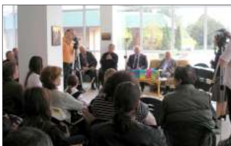
Conferin e de pres i prezentare de carte la Galer iile de Art