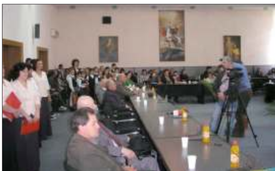
Sala Consiliului Jude ean la deschiderea simpozionului

Ecomondia a fost onorat s participe la acest simpozion, s conferen ieze la coli din Vaslui, s vorbeasc la radioul local i s scrie articole în ziarul Meridianul .