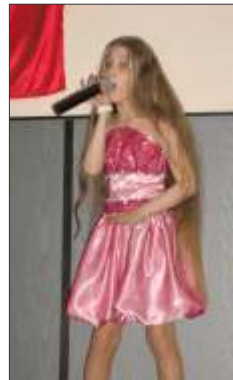
O feti , o elev , o artist